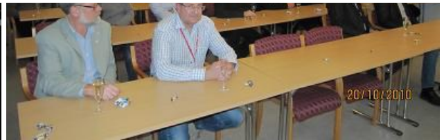
Intresserade åhörare på KNX träffen lyssnar på nyheterna i ETS4!